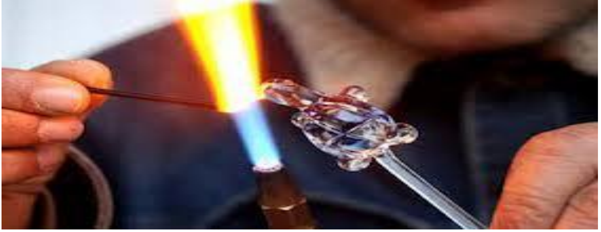
Şekil 10. Cam sanatı ( https://www.ustamgeliyor.com/blog/cam-isleme-ustalari/ sayfasından erişilmiştir.)