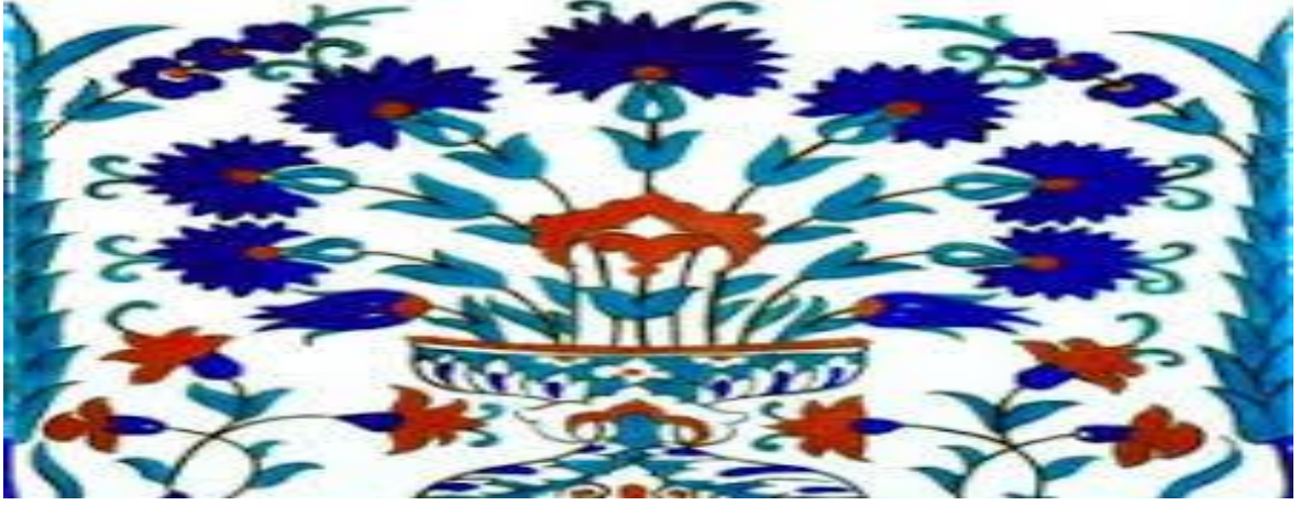
Şekil 12. Çinçilik sanatı ( http://anadoluelsanatlari.blogspot.com/2012/12/cinçilik.html sayfasından erişilmiştir.)