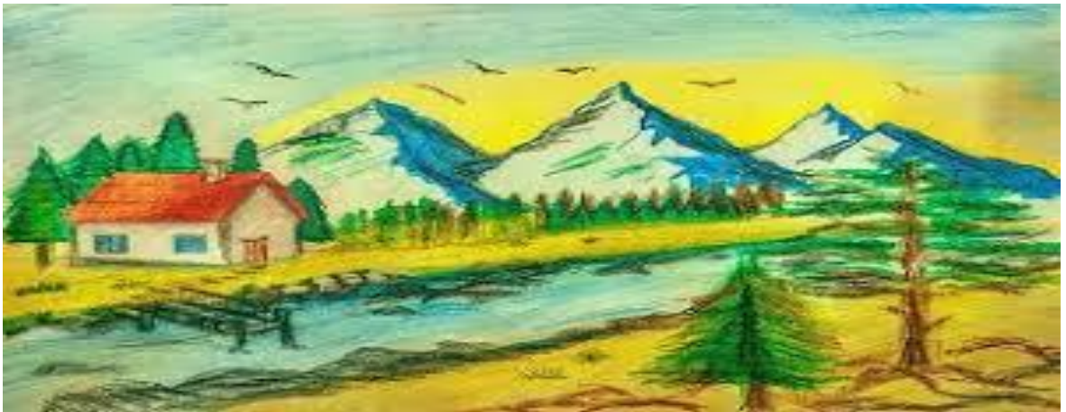
Şekil 18. Manzara 4 ( https://www.enkolaybilgi.com/15-adet-en-kolay-cizilen-manzara-resmi/ sayfasından erişilmiştir.)