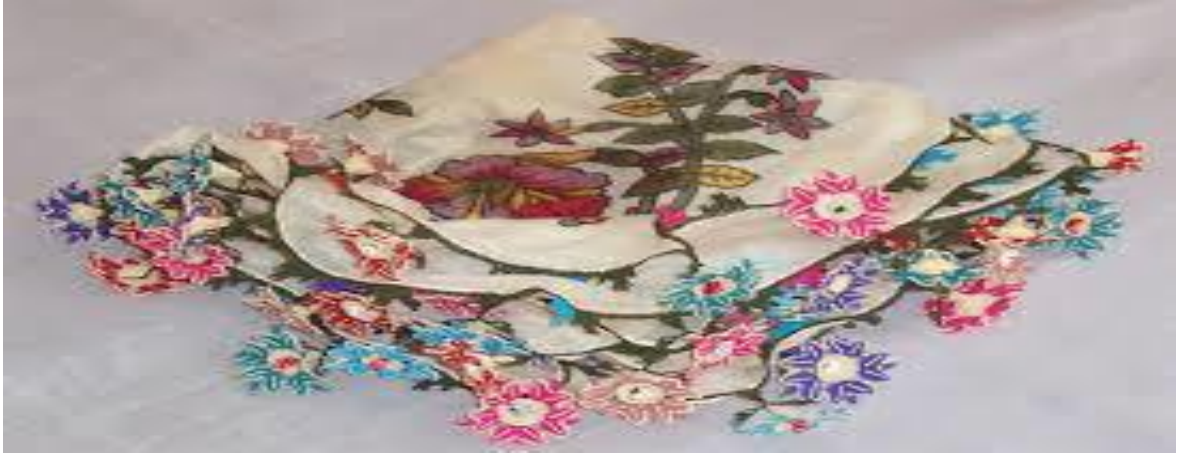
Şekil 9. Oyacılık ( https://tr.pinterest.com/pin/842173199041057105/ sayfasından erişilmiştir.)