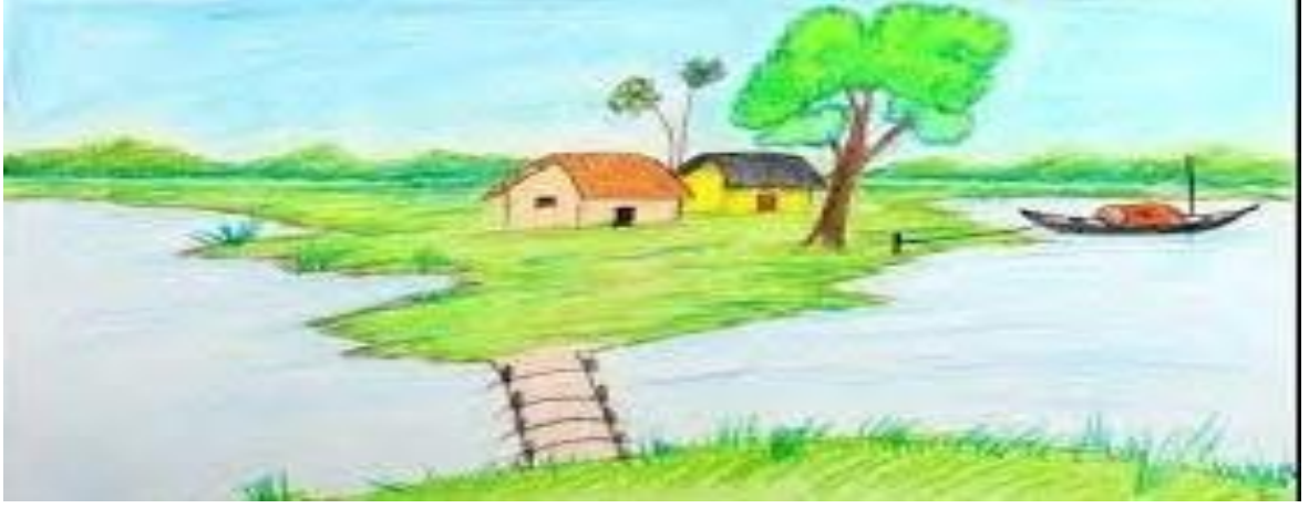
Şekil 16. Manzara 2