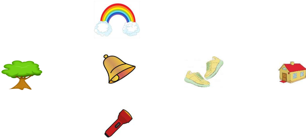
Şekil 14. Hikaye küpü örneği (açık hali)