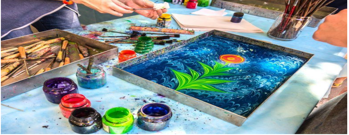
Şekil 6. Ebru sanatı ( https://www.zingat.com/blog/ebru-sanati-ile-evinizi-renklendirin/sayfasından-erişilmiştir .)