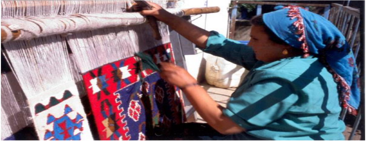
Şekil 7. Halı dokuma sanatı ( https://www.hakkindabilgi.org/denizlide-dokumacilik-hakkında-kısa-bilgi/sayfasından-erişilmiştir .)