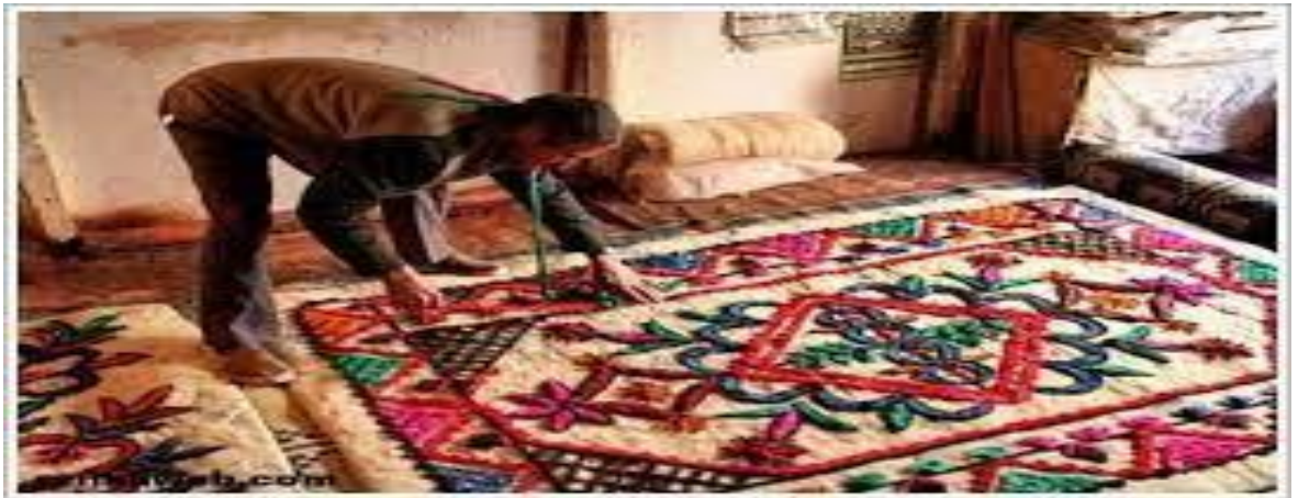
Şekil 11. Keşecilik sanatı