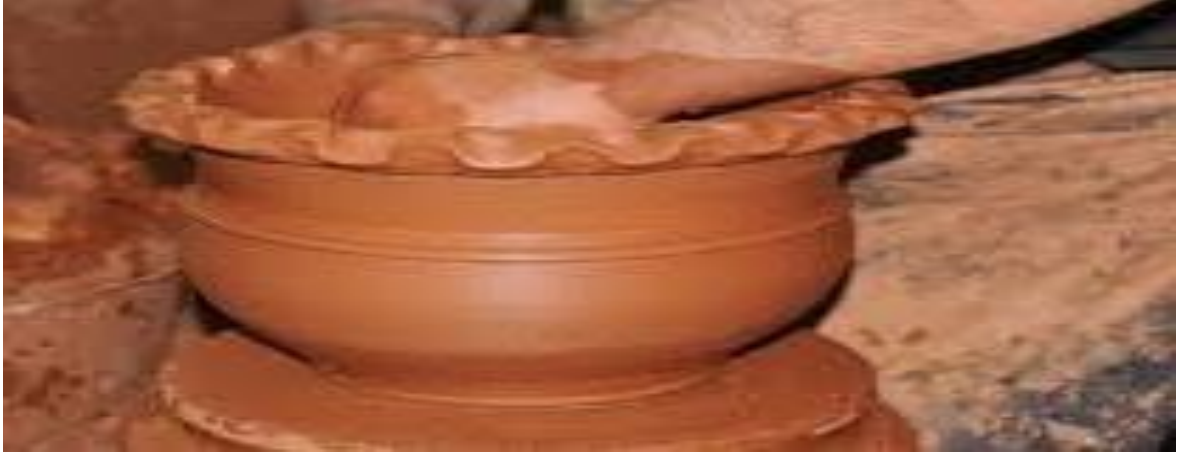
Şekil 13. Çömlekçilik sanatı