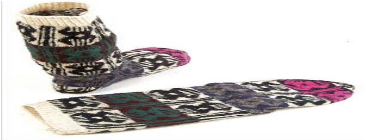
Şekil 5. Örgü örme sanatı