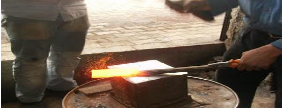
Şekil 3. Demircilik sanatı