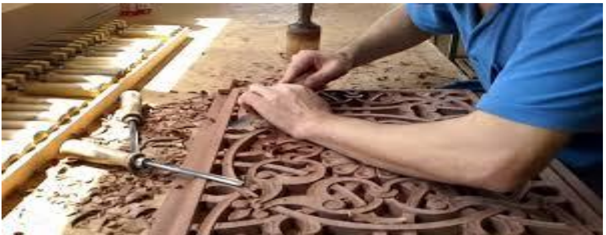
Şekil 8. Oymacılık sanatı ( https://www.sondakika.com/haber/haber-yarım-asırdır-ahşap-oyuyor-9399773/sayfasından-erişilmiştir .)