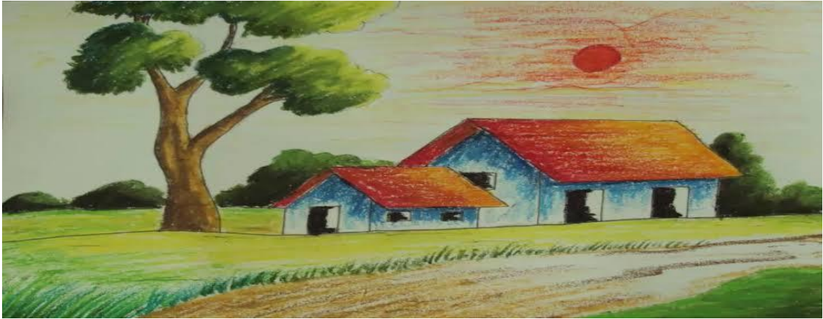
Şekil 15. Manzara 1. ( https://www.enkolaybilgi.com/15-adet-en-kolay-cizilen-manzara-resmi/ sayfasından erişilmiştir.)