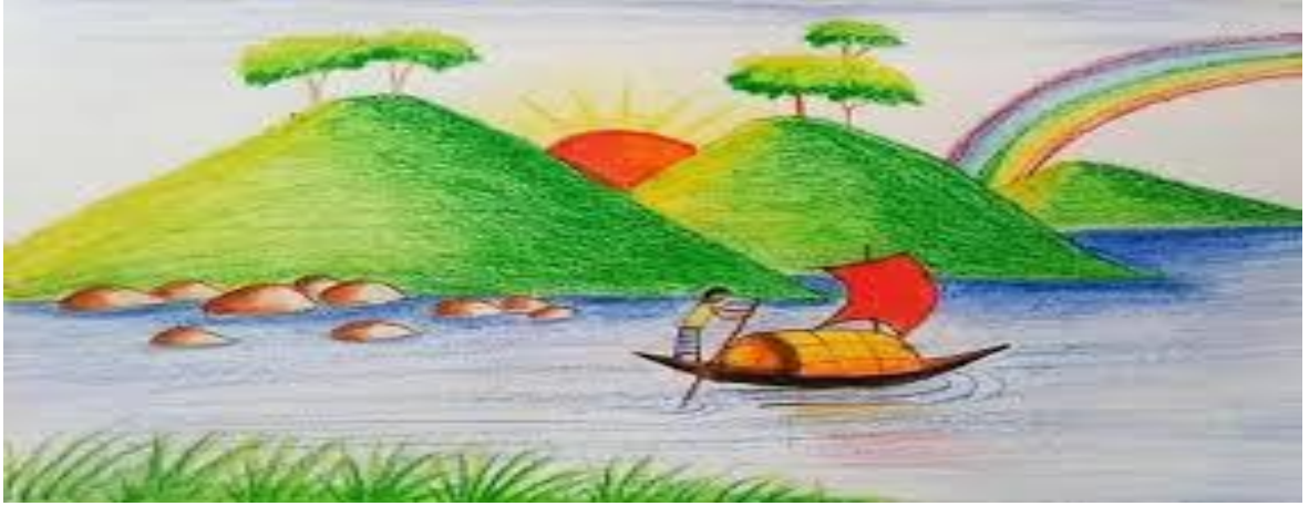
Şekil 17. Manzara 3